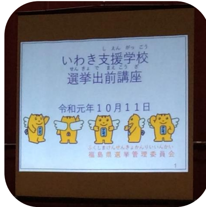
スライドで候補者の選び方や投票の仕方について学びました