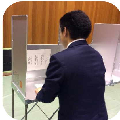
記入機で候補者の名前を記入しました