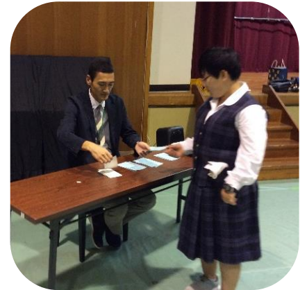
受付で名前の確認を受け、投票用紙を受け取りました