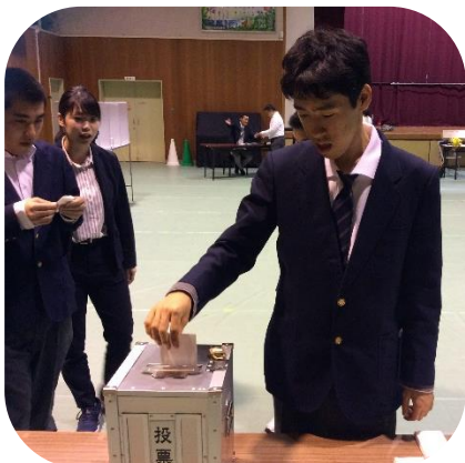
緊張しながら一票を投じました