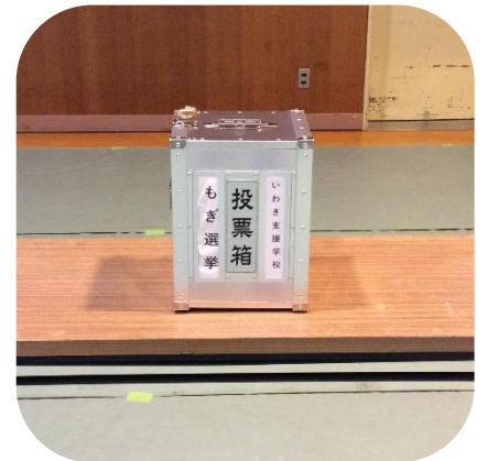
地区の有権者数によって投票箱の大きさが違うそうです