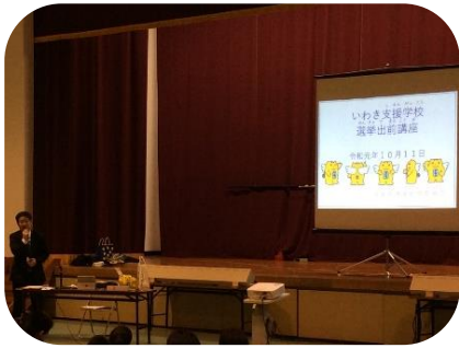
選挙管理委員会職員の方から選挙の説明を聞きました

候補者の選び方・投票の仕方・期日前投票など、選挙についての説明を聞いたあと、投票所での受け付けから投票までの流れを本物と同じ投票用紙や投票箱を使って体験しました。生徒たちは緊張した表情で投票に臨みました。