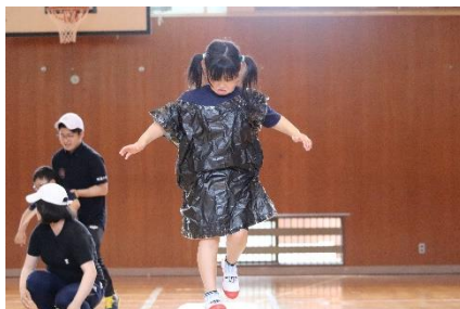
3・4年団体種目 「みんなでしゅうだんこうどう」