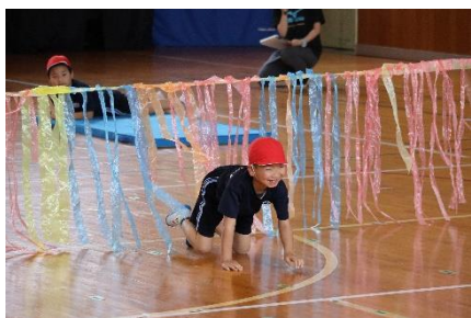
1、2年個人種目 「げんきいっぱい アンパンマン」

5月31日（金）に、本校体育館にて小学部の運動会が行われました。子どもたちはお父さん・お母さんに見てもらおうことを楽しみに、この日に向けて各グループで学習を頑張ってきました。当日は暖かい声援に励まされながらこれまでの成果を発揮することができました。たくさんの応援、ありがとうございました！