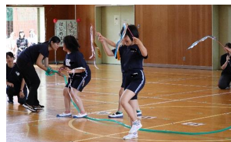
5、6年個人種目 「いわきリンピック ～めざせ TOKYO2020～」