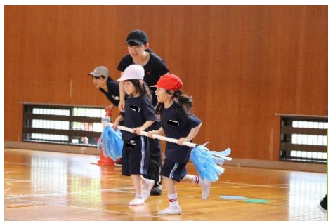
1・2年生団体種目 「おおきなぼとんいれー」