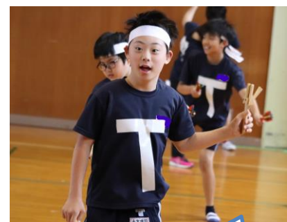
5・6年団体種目 「いわキッス ソーラン」