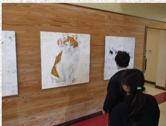
壁には、たくさんのアート作品が飾っており、施設内は落ち着いた雰囲気でした。