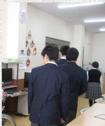
印刷業務：ポスターや名刺の編集をしていました。