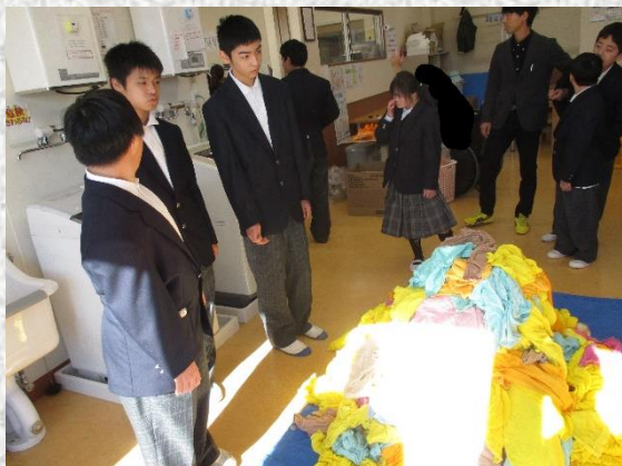
洗濯業務：大量のタオルを洗濯していました。

11月15日にいわき自立生活センター「ミント」と「アライブ」に校外学習に行ってきました。事業所では、業務用洗濯機でのクリーニングやパソコンでの名刺作成、防虫剤部品の組み立てや編み物での手芸品制作等の様子を見学させていただきました。利用者みなさんは、集中して丁寧に作業に取り組んでいました。また、職員の方からは「働くうえで大事なこと」と題して、生徒へ働くことについてのイメージがもてるよう『あいさつ』や『ほうれんそう（報告・連絡・相談）』、また一日作業をする上で『体力』や『集中力』が必要であること等のお話をいただきました。