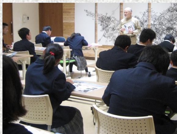
職員の方からの話を、真剣に聞いています。