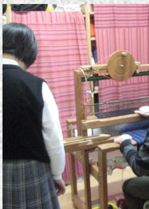
さをりおり：丁寧に作業されていました。