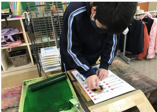
〈中学部クラフト班でのカレンダーづくりを体験する小学部6年生〉

また、作業学習の活動の目的を学ぶ中で、家族の仕事や、自分の周囲の人がしている仕事にも興味をもち、自分が大人になったらやってみたい仕事など、将来について考える機会とすることができました。