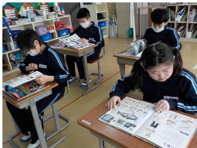
〈いろいろな仕事について書かれている本を見て、自分のやってみたい仕事や興味がある仕事を探している様子〉

作業学習体験後、学級で「仕事」について学習をしました。どんな仕事があるのか、なぜ大人は働くのかなど学ぶ中で、「家族の人がしている仕事と同じことをしてみたい」、「大好きなケーキを作る仕事をしたい」など自分がやってみたい仕事についても考えていくことができました。